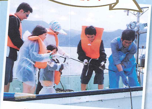
釣り体験 (体験者募集!先着45名) ※参加料 一般4,320円(小学生以下3,240円)