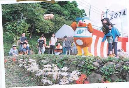
俵投げ大会 (参加者募集!) ※参加料 お1人様 500円