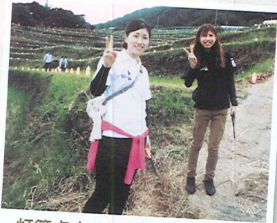
灯籠点火 (体験者募集!先着50名) ※参加料 お1人様 1,000円